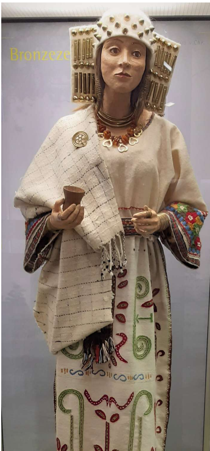
Auf Reisen: Die Puppe, die auch „Braut von Fallingbostal“ genannt wird, ist derzeit nach Schöningen verliehen.

Zum Abschluss der Saison hat das Museum in Bad Fallingbostal am 31. Oktober 2020 ein letztes Mal im Jahr 2020 geöffnet. Der Eintritt ist frei, Spenden werden akzeptiert. Die „Braut von Fallingbostal“ ist erst in der kommenden Saison, ab April 2021, wieder zu Hause.